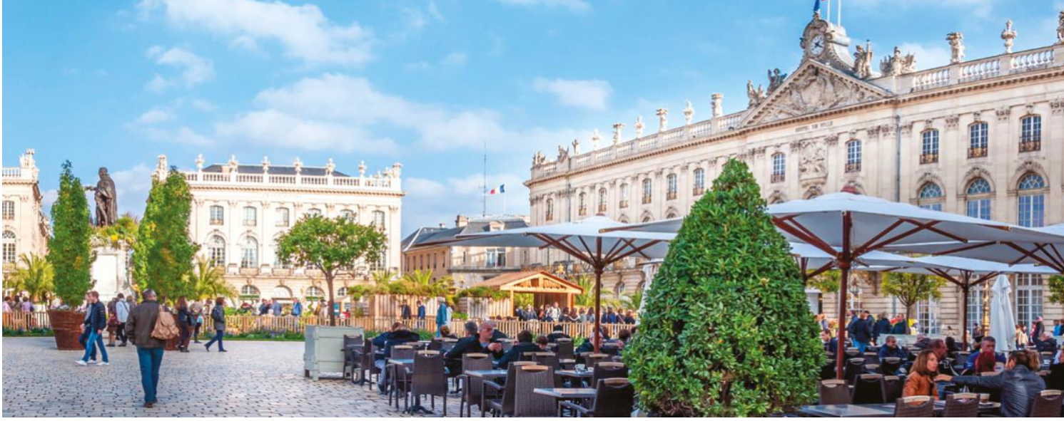
图：南锡市中心斯坦尼斯拉斯广场（被联合国教科文组织评选为“世界遗产”，也是欧洲最美丽的广场之一）